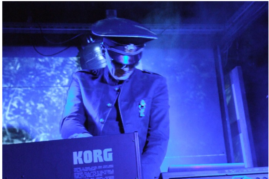
Live aux Combustibles